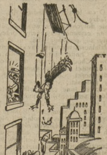
Boże! dzięki Ci, że nie jestem żonaty...