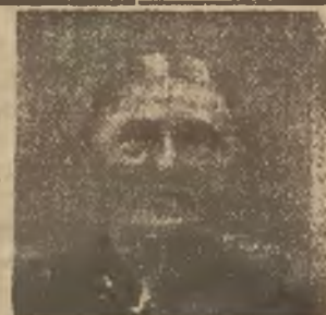
Dahlen i. Oldenburg d. 20/VIII. 1930.

Komunikuję, że Fregalin oddał mi wielką przysługę. Dawniej czułam się zawsze bardzo zmęczona i praca udawała mi się z trudem. Obecnie czuję się, nie bacząc na moje 76 lat rzeźka i zdrowa, a praca mnie nie wyczerpuje. Dziękuję za pomoc. Fregalin będę zawsze polecać.