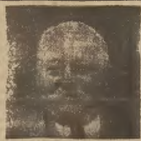
Od 15-tu lat cierpiam na reumatyzm stawów - teraz zdrów mimo 70-ciu lat.