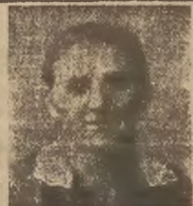
Welschenhorn (Schwaben) Mühlstrasse 1. d. 6. 4. 30.

Po użyciu Fregalinu czuję się już tak dobrze, jak nigdy jeszcze. Odczuwam znów apetyt i mogę wszystko jeść, wówczas gdy dawniej jedzenie wywoływało torsje. Cierpienia kobiece, które dawniej bardzo mnie męczyły, ustąpiły całkowicie.