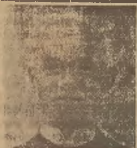
Lückerdorf 79. Po. Kamanz i. Sa. d. 10. 9. 30.

skoro fakty, które przytaczamy, dotyczące naszego od lat znanego środka odradzającego krew i wzmacniającego nerwy „Fregalin”, są wywniośniejsze, niż najpiękniejsze słowa. Tysiące osób, które już wypróbowały „Fregalin”, nie zaznały zawodu. Nad wyraz skutecznym okazał się „Fregalin” przy nerwowości, ogólnym osłabieniu, zmęczeniu, zawrotach głowy i cierpieniach reumatycznych. Poradźcie się lekarza. By móc uporać się z trudnościami, z jakimi zwąza na jest walka o byt, trzeba mieć silne nerwy, zdrową krew. Prosimy dokładnie przeczytać, co piszą do nas o działaniu „Fregalinu” osoby, których fotografie podajemy, a sami osądzicie, czym jest „Fregalin”. W naszym archiwum znajdują się tysiące podobnych listów dziękczynnych z kraju i zagranicą, nadesłanych do nas jako wyrazy wdzięczności i zadowolenia. Każdy może je obejrzeć w naszym biurze. — Wszystkie listy dziękczynne poświadczające są przez notariusza. „Fregalin” można nabyć we wszystkich aptekach. Wysyłkę uskutecznia Antus-Apothek, — Gdańsk. Wytwarzamy pod kontrolą powag naukowych.