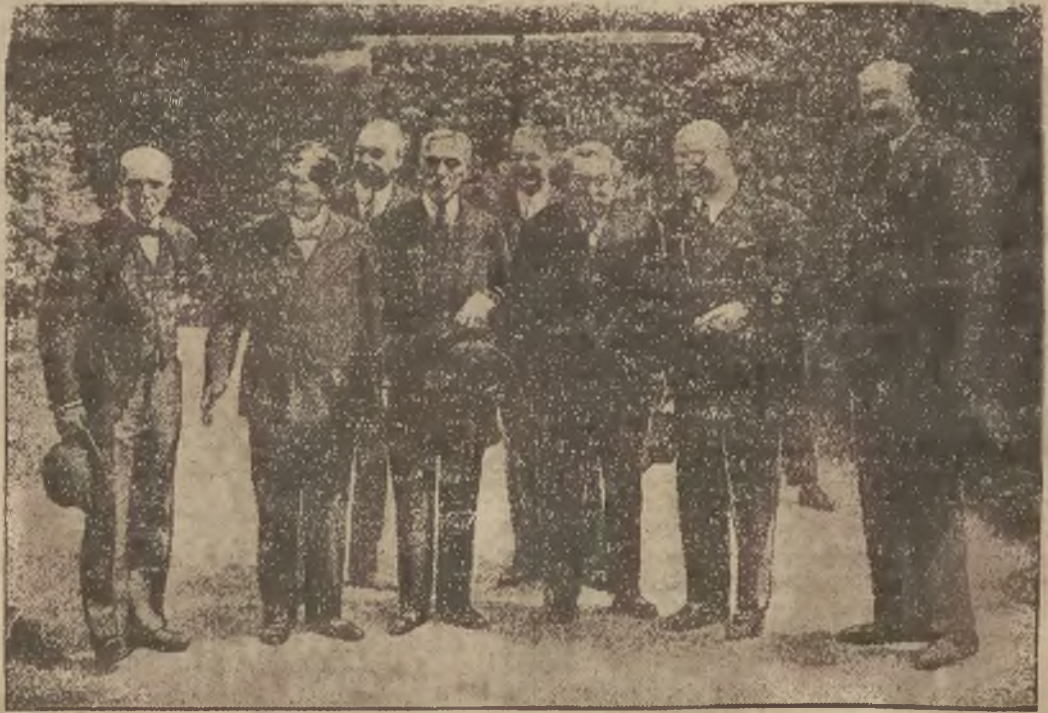
Stoją w środku od lewej ku prawej: Pietri francuski minister budżetu, premier Laval, min. Mellon, min Briand, ambasador Stanów Zjednoczonych w Paryżu Edge i minister skarbu Flandrii.