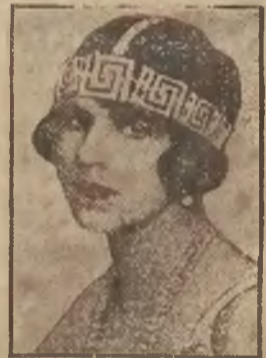
Królowa rumuńska Helena