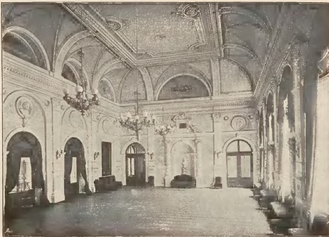
SALA BALOWA W DWORCU ZDROJOWYM.

Urządzony jest bardzo wykwintnie, położony w uroczym miejscu, na wzniesieniu, z frontem, zwróconym na park, zaś z widokiem rozległym na wszystkie otaczające wzgórza. Właściciel wynajmuje w nim pomieszkania, także za unowioną cenę na dłuższy pobyt. Obok hotelu Warszawskiego znajduje się „Villa Flora“, tegoż samego właściciela, również gustownie, po hotelowemu urządzone.