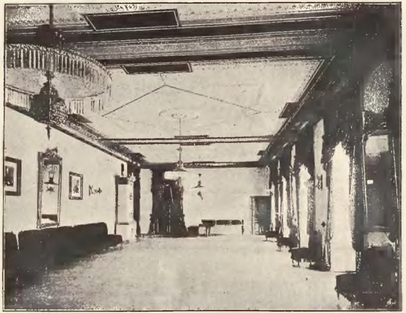
SALA KONCERTOWA DWORCA ZDROJOWEGO.