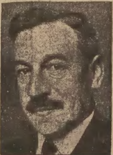
Sir Herbert Samuel

Urodzony w r. 1870 w Liverpoolu, poświęcił