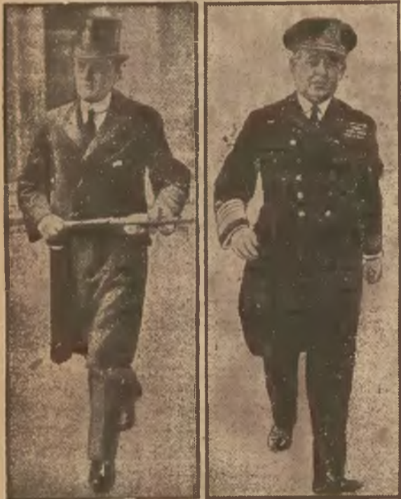
Pierwszy lord admiralicji Austen Chamberlain

Wydawnictwo Ullsteina ogłosiło komunikat protestujący przeciw poglądom o jego bankructwie. Od dłuższego czasu z rozmaitych stron rozszerzają plotki, że wydawnictwo Ullsteina, zatrudniające 10,000 ludzi, znajduje się w trudnościach finansowych. Wydawnictwo Ullsteina stwierdza, że przez cały czas kryzysu redukcje nie objęły nawet dwóch procent personalu. W interesie własnego personalu zwróciło się wydawnictwo do pruskłego ministerstwa sprawiedliwości, z apelem, by zmienić dotychczasową praktykę prokuratorji, która nie ściga autorów tego rodzaju szkodliwych poglądów. Wydawnictwo Ullsteina zapowiada