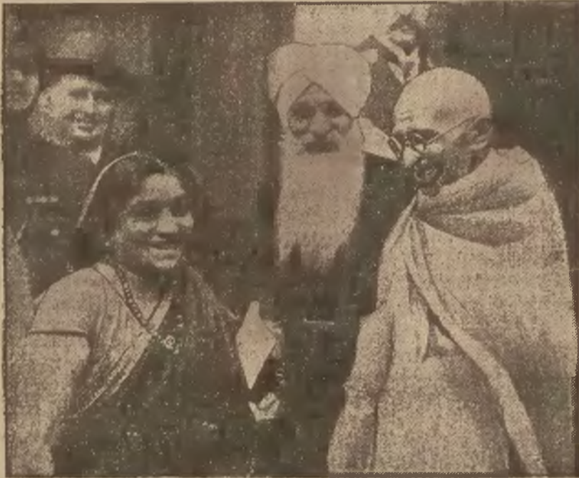
Gandhi i jego towarzyszką p. Naidu wychodzą z pałacu St. James, gdzie odbywa się konferencja „okrągłego stołu“.

przezwany Mahatmą (Wielka Dusza), urodził się w Porbandar 2 października 1869 roku. — Pierwsze nauki pobiera w kraju, na wyższe studia jedzie do Londynu, kończy prawo i praktykuje jako adwokat w Bombaju (1891). Wezwany w sprawach zawodowych do Południowej Afryki, od razu rzuca się w wir walki o wolność dla osadników hinduskich w Kaplandzie. Tu właśnie po raz pierwszy stosuje swą koncepcję stawiania oporu „biernego“. Porzuca zawód adwokacki i funduje kolonię dla swych rodaków w pobliżu Durbanu. W roku 1914 Gandhi wraca do Indii. Wojna światowa przerywa jego działalność polityczną. W roku 1919 Gandhi, w odpowiedzi na ustawy angielskie, godzące w wolność Indii, rzuca milionowym rzeszom Hindusów wezwanie bojkotu władz angielskich. „Celem naszej walki, — mówi Gandhi, — jest przyjaźń z całym światem. Opór bierny zjawia się już i pozostanie. Jest on zwiastunem pokoju świata“. Wierny swojej zasadzie, zawiesza walkę, gdy jego rodacy zaczynają czynnie walczyć o wolność swego kraju, sam bez sprzeciwu idzie do celi więziennej. Ruch wyzwolenieczy Indii dosięga zenitu w pierwszych miesiącach 1930 roku. — Gandhi znów rzuca hasło do oporu biernego,